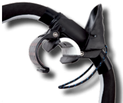
#216 Poignée avant wish Pro one