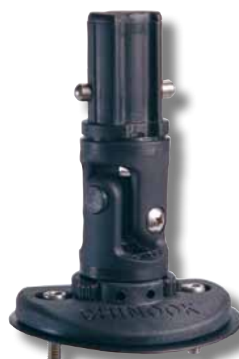
#55 avec cardan