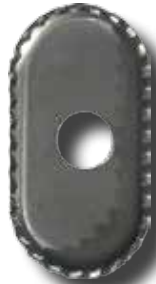
#GWH Rondelle «Alligator»