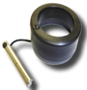
#169 bague pour rallonge RDM