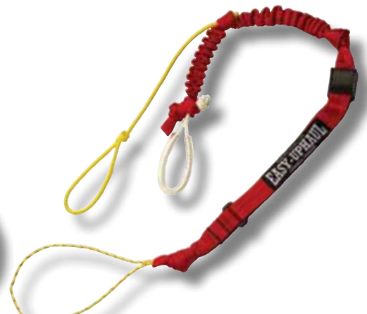
#612 Tire veille easy-up-haul