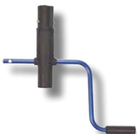
#200 Manivelle US