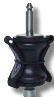
#52P liaison diablo