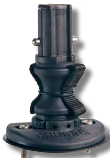
#52 avec diabolo