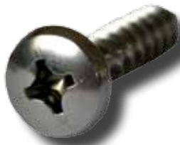
#645 Vis «cobra»