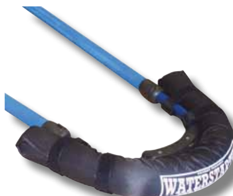
#610 Waterstarter Facilite le waterstart