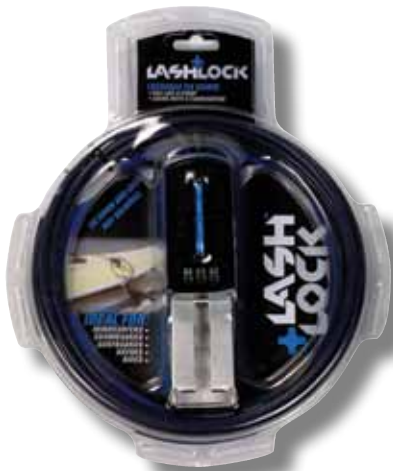
#540 Cable antivol à code