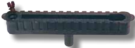
#302 boîtier court 8" ventilé avec vis