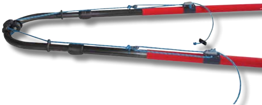
#259 Kit palan d'écoute complet