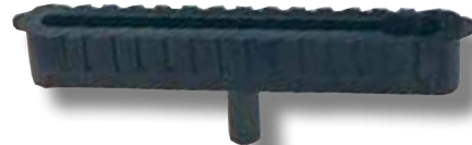
#304 boîtier court 8"