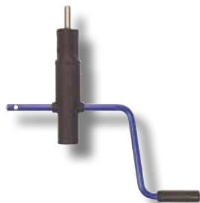
#200E Manivelle européen