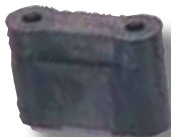
#341 Insert 2 vis