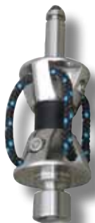
#73P liaison tendon