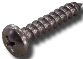
#350 Vis perforante Chinook