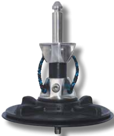
#51P avec tendon