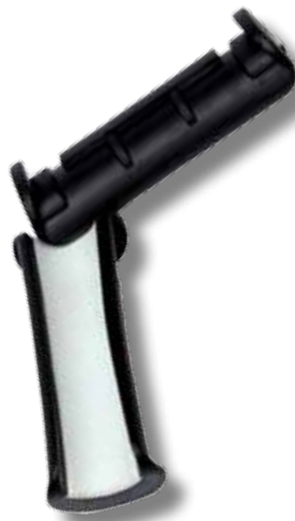
#221 adaptateur RDM Pro one