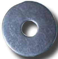
#371 Rondelle vis de strap