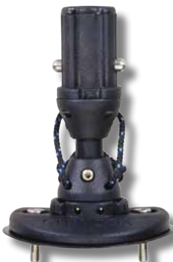
#53 avec tendon