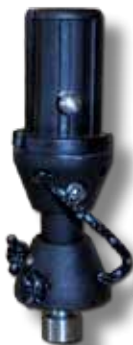
#73 liaison tendon