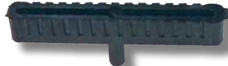
#303 boîtier US court 8"