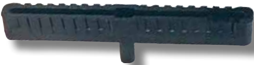
#300 boîtier US long 10"