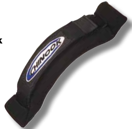
#510 Footraps réglage rapide