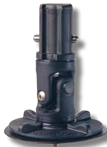
#54 avec cardan