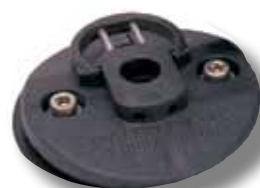
#61 base 2 vis seule