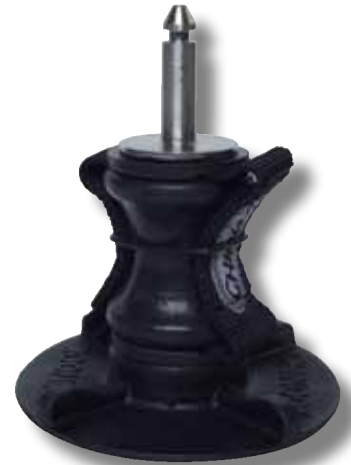
#50P avec diablo