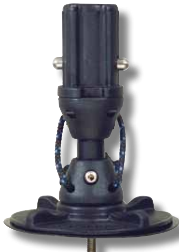
#51 avec tendon