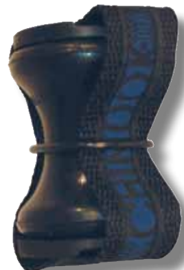
#122 diablo Kinetic + sécurité + rondelles