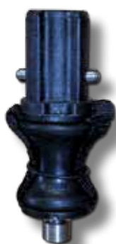
#72 liaison diabolo