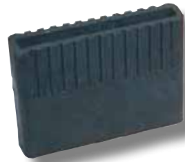
#305 boîtier Tuttle