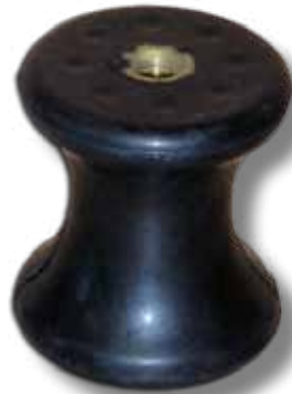
#120 diablo Kinetic seul