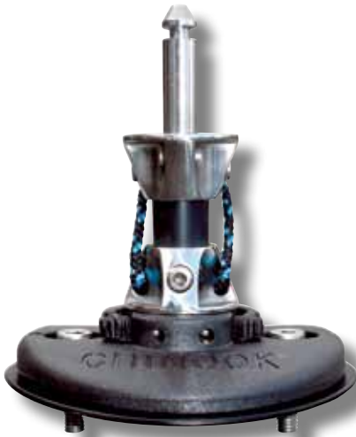
#53P avec tendon