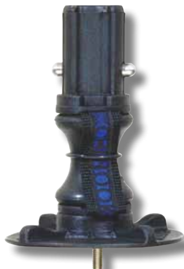
#50 avec diabolo