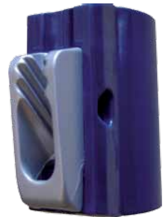
#194 taquet coinreur