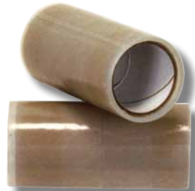
#575 Monofilm autocollant Haute Résistance