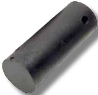
#111 tendon chinook