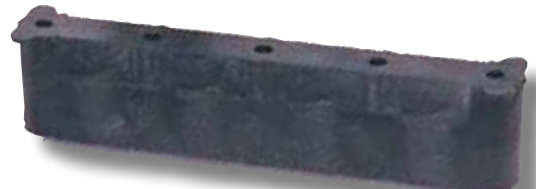
#340 Insert 5 vis