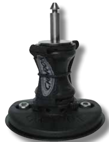
#52P avec diablo