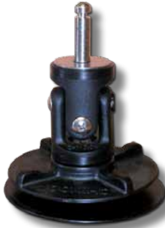
#54P avec cardan