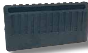
#306 boîtier Power box