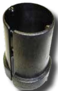
#168 bague pour rallonge SDM