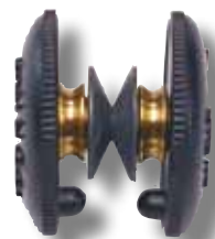
#177 double poulie métal pour l'écoute